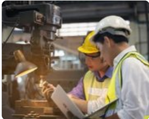
글로벌 양산 연계 글로벌 가격 경쟁력 확보를 위해 안정적으로 해외 양산 연계를 지원합니다.