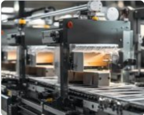
크렐로 제조 인프라 다양한 양산 기술을 지원하며 규격 부품류들을 고객 맞춤으로 소싱합니다.