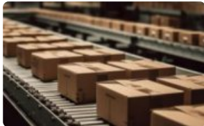
양산 서비스 완제품 가공·소장·조립 양산 제조