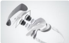
설계 시제품 제작 서비스 디자인부터 시제품 목업까지