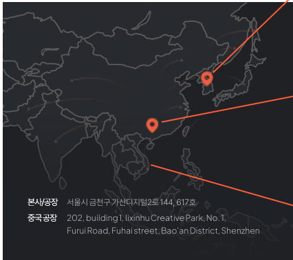
본사/공장 서울시 금천구 가산디지털2로 144, 617호 중국 공장 202, building 1, lixinhu Creative Park, No. 1, Furui Road, Fuhai street, Bao'an District, Shenzhen

한국 본사와 중국 지사를 중심으로 품질 · 납기 · 보안을 책임지고 관리합니다.