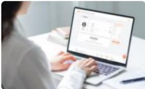
AI 실시간 제조 서비스 빠른 온라인 자동 견적 확인과 주문관리