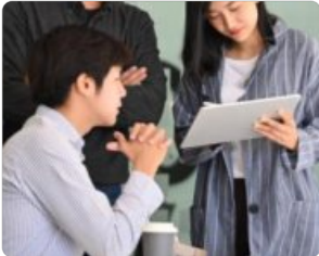
설계팀과의 연계 내부 설계팀과 협업하여 원활한 양산 진행을 지원합니다.

비용과 효율성을 고려한 다양한 생산 옵션을 제공함과 동시에, 철저한 공급망 관리를 통해 품질과 일정, 가격 경쟁력을 철저히 관리합니다.